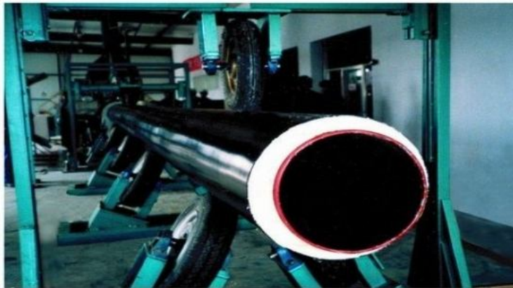
钢管道防腐保温“新一步法”粉末、泡沫黑夹克新结构